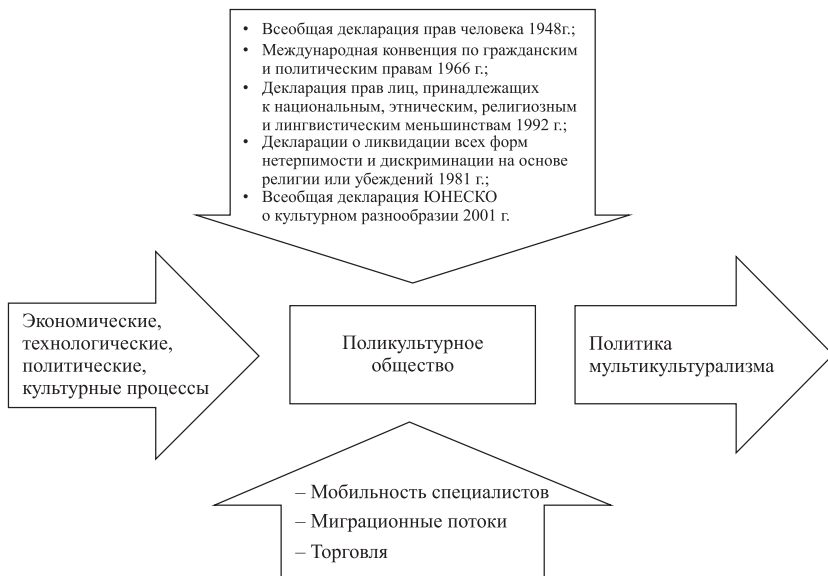
Рис. 1. Концепция мультикультурализма как часть политической идеологии

дации всех форм нетерпимости и дискриминации на основе религии или убеждений 1981 г.; Декларации прав лиц, принадлежащих к национальным, этническим, религиозным и лингвистическим меньшинствам 1992 г.; Всеобщей декларации ЮНЕСКО о культурном разнообразии (2001 г.) (Приложения 1–3).